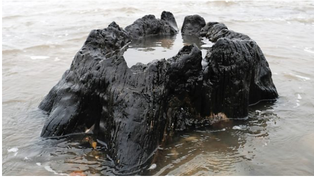
Oeroude boomstronk die van onder het zand werd blootgespoeld