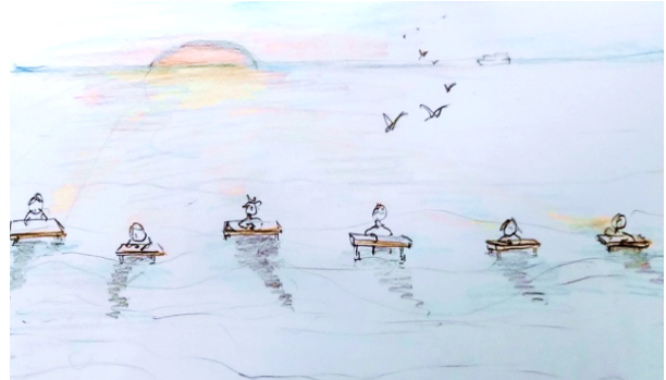
Schets van een schrijfperformance in zee

Op al deze manieren gaat TESTEREP over die grijze en mysterieuze Noordzee, waarvan de rand veel minder vastligt dan we ons voorstellen. Als bijna een levend wezen heeft de zee ons gevormd, heeft ze ons land gevormd en de mensen die er wonen: het 'Flamenland' – het overstroomde land. Zonder vaste identiteit: beweging, versmelting, vervorming is onze identiteit. Overstroomd worden is misschien wel onze aard. Verhuizen. Nieuwe plekken zoeken. Aanpassen. Versmelten. Mee bewegen. Over die zee die nu een pretpark is, maar eerlangs vooral een bron van rijkdom, een verbindingsweg naar andere landen; tegelijk een bedreiging en een mogelijkheid, eerder een doorgang dan een grens. Maar TESTEREP gaat ook en vooral over de niet aflatende, maar steeds falende, poging van de mens om de natuur – om de zee - te temmen. Met duinenrijen, dijken vol kraampjes en torenhoge appartementsgebouwen hebben we een muur voor de zee gezet. Maar die zee, die laat zich niet kooien. En hoe wij op de kust ingrijpen, bepaalt – zoals in het historische Testerep – hoe de zee ingrijpt op ons. De link met de klimaatverandering ligt voor de hand.