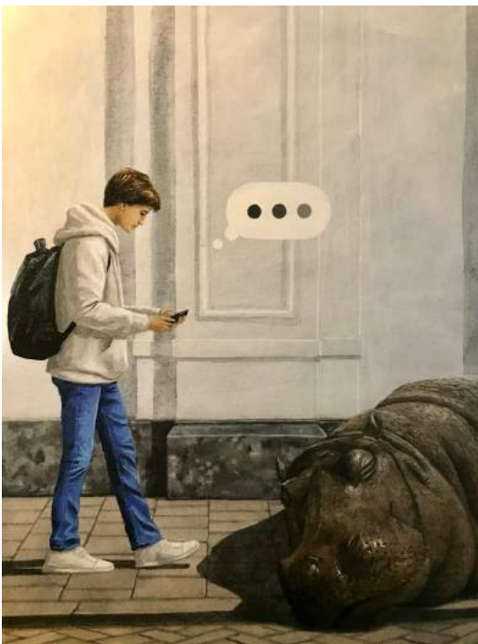
TEKST Edward van de Vendel ILLUSTRATIE Martijn van der Linden

Allereerst: sorry zeggen. Daarna: met jezelf overleggen hoe je hem terug gaat laten struikelen. Pfah. Alsof dikhuiden de enigen zijn die hun gewicht mogen gebruikelen! Ik zou als ik jou was alle zoetigheid in huis tevoorschijn proberen te duikelen: alle slagroom en snoep, in alle kannen en kruimelen, en dat opeten, opeten om dan, met opbollende billen en uitpuilende buikelen, elk nijlpaard dat in de weg loopt ondersteboven te duikelen